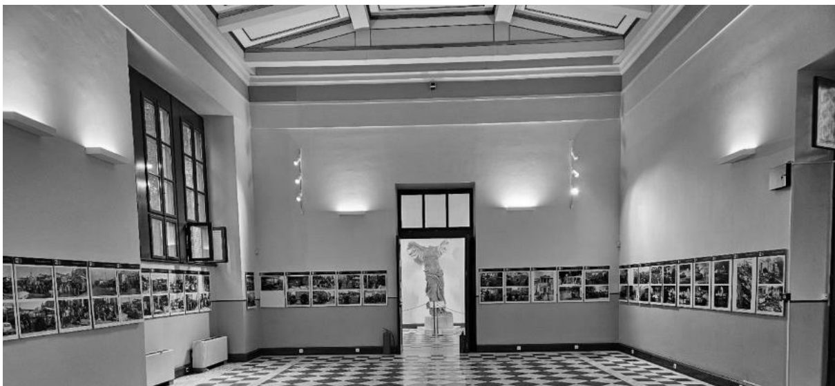
Ο χώρος έκθεσης στο κτίριο της πρυτανείας https://www.ntua.gr/media/k2/items/cache/9880c821bdbf8aaf75e475bdb5d55822_L.jpg

Στο ισόγειο του κτιρίου της πρυτανείας έχει δημιουργηθεί χώρος έκθεση με οπτικό και άλλο υλικό από την εξέγερση του Νοέμβρη του 1973. Σε αυτή τη φάση δεν προτείνεται η διαμόρφωση της έκθεσης. Οι συμμετέχοντες θα πρέπει να λάβουν υπ' όψιν τη χωροθέτηση αυτής της έκθεσης και στην πρότασή τους και να προτείνουν τρόπους που να βοηθούν του επισκέπτες να κατευθυνθούν προς την έκθεση.