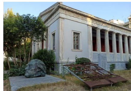
Άποψη της περιοχή μελέτης

Μέσα στην περιοχή αυτή υπάρχουν έξι διακριτά σημεία ειδικού ενδιαφέροντος για τα οποία οι συμμετέχοντες καλούνται να προτείνουν το σχεδιασμό της χωροθέτησης, συνύπαρξης και πιθανής συσχέτισης μεταξύ τους. Τα σημεία αυτά αφορούν το φυλάκιο εισόδου, την ιστορική πόρτα, το γλυπτό κεφαλής, τη στήλη πεσόντων φοιτητών Κατοχής, μια νέα αναγραφή των νεκρών της εξέγερσης του Πολυτεχνείου, και το χώρο έκθεση στο κτίριο της Πρυτανείας).