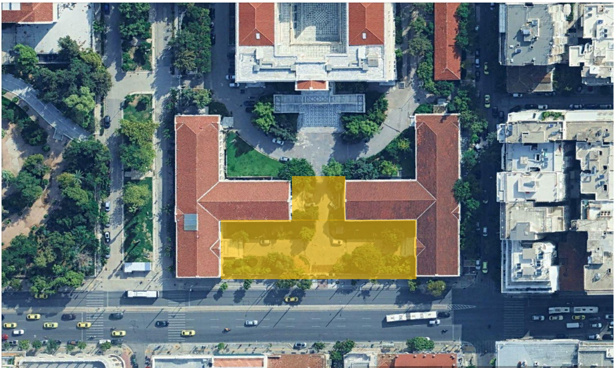
Η περιοχή μελέτης σημειώνεται στις παραπάνω φωτογραφίες με κίτρινο χρώμα.

Μέσα στην περιοχή αυτή υπάρχουν έξι διακριτά σημεία ειδικού ενδιαφέροντος για τα οποία οι συμμετέχοντες καλούνται να προτείνουν το σχεδιασμό της χωροθέτησης, συνύπαρξης και πιθανής συσχέτισης μεταξύ τους. Τα σημεία αυτά αφορούν το φυλάκιο εισόδου, την ιστορική πόρτα, το γλυπτό κεφαλής, τη στήλη πεσόντων φοιτητών Κατοχής, μια νέα αναγραφή των νεκρών της εξέγερσης του Πολυτεχνείου, και το χώρο έκθεση στο κτίριο της Πρυτανείας).