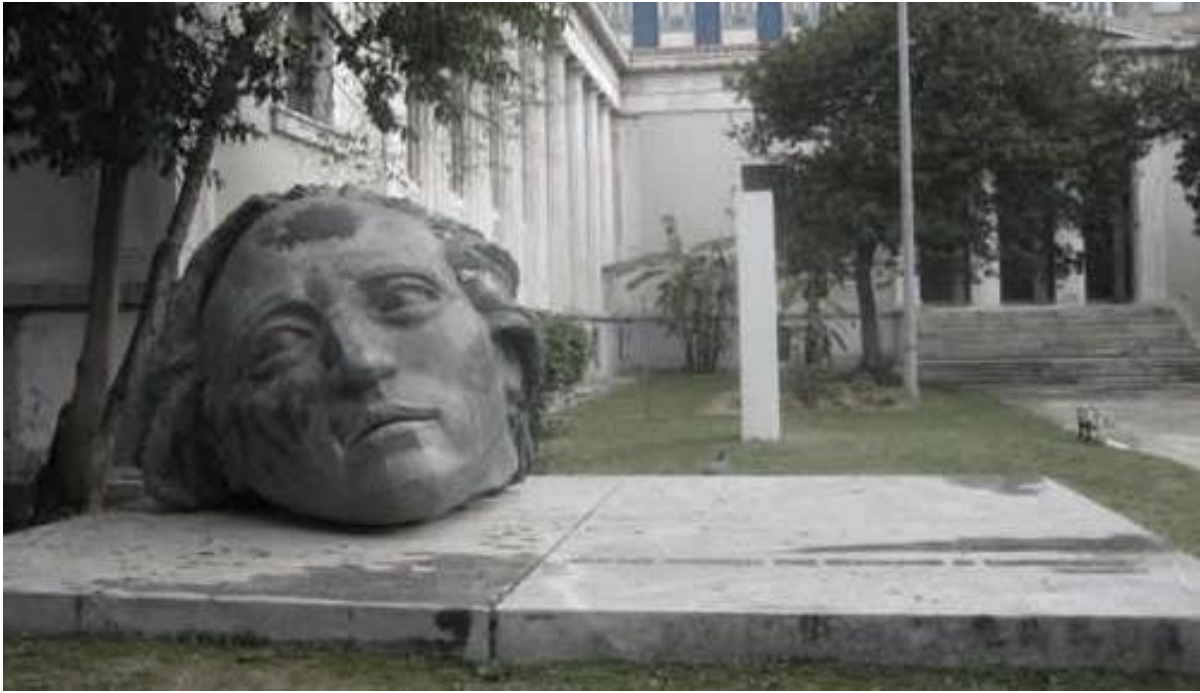
Το γλυπτό της κεφαλής με την βάση, πιο πίσω φαίνεται η στήλη πεσόντων φοιτητών κατοχής.